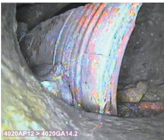
Aktuelle Aufnahmen der Stadtwerke aus dem Kanalsystem am Hauptplatz